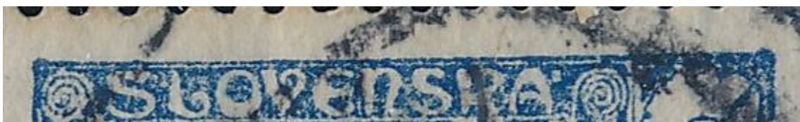
nahoře obr. 4

Obrázek 4 představuje 80. ZP, kde rám je bez porušení. Dále obr. 4a, kde poškození na tomto ZP vypadá jako vrypy a je ze všech ZP největší. Nachází se na známkách zoubkovaných A i D.