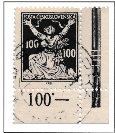
6. TD – řádkové zoubk.

Od 7. TD se vyskytují v ochranném rámu číslice: