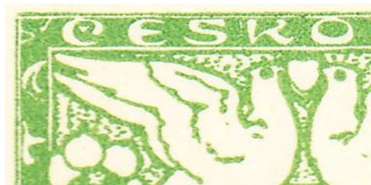
Obr. 3 – Běžné známkové pole

Knihtisková vydání i po téměř 100 letech poskytují sběratelům potěšení z dalších možností rozšíření sbírky. Pokud některý ze sběratelů vlastní zkusmý tisk této známky ze 40. ZP TD I ještě s původní vadou, prosím podejte mi o tom zprávu.