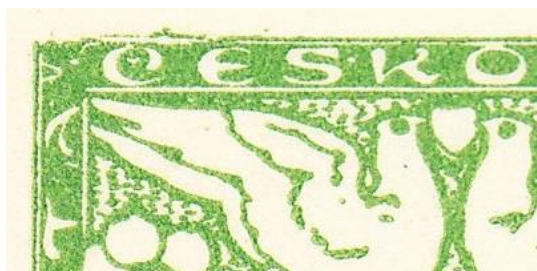
Obr. 1 – ZP 39

Svědčí o tom poškození sousedního 39. známkového pole (obr.1). Je zde výrazně poškozen levý horní roh. Na ZP 40 bylo poškození patrně ještě závažnější, protože byla poškozena písmena nápisu ČESKO. Tento nápis bylo samozřejmě nutné opravit. Písmena po opravě mají však viditelně jiný tvar (obr. 2). Na (obr. 3) je běžná podoba písmen ČESKO.