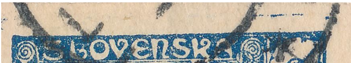
nahoře obr. 5

Obdobně na obrázku 5 – 90. ZP, kde pravý rám je nepoškozen; obr. 5a, kde vruby v pravém rámu jsou menší než na ZP 80, ale také velmi výrazné.