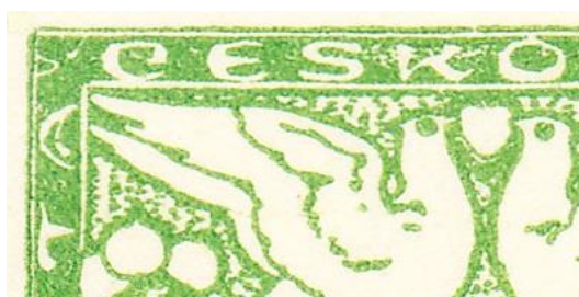
Obr. 2 – ZP 40