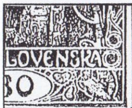
60. ZP II. TD 66. ZP