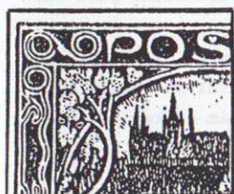
67. ZP II. TD 70. ZP