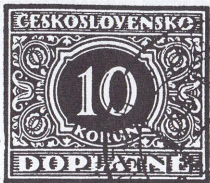
obr. č. 2