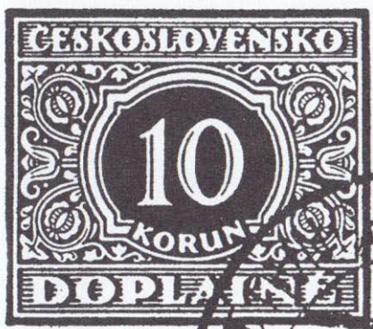
obr. č. 1