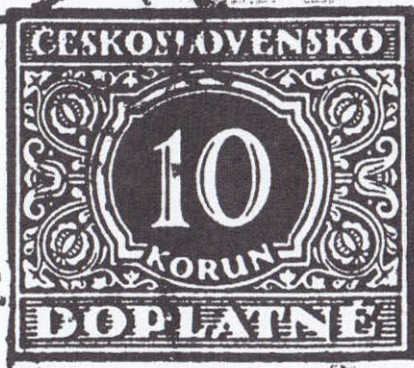
obr. č. 2a

To samo by nebylo nic pozoruhodného nebýt textu v MONOGRAFII č. 4 kde je na straně 229 uvedeno cituji " Matrice zpravidla nebyly použity k vlastnímu tisku známek s výjimkou matric hodnot 5 h, 5 Kč a 20 Kč, které jsou opatřeny deskovým označením a mají otvory pro upínací hřebíčky, pro ostatní hodnoty byly tiskové desky odvozeny z příslušných matric galvanoplasticky. Matrice všech hodnot jsou uloženy v Poštovním muzeu spolu s příslušnými fotografickými negativy", konec citátu. Ani zmínka o tom, že tisková deska hodnoty 10 Kč s označením 28/1 byla také tištěna z matrice.