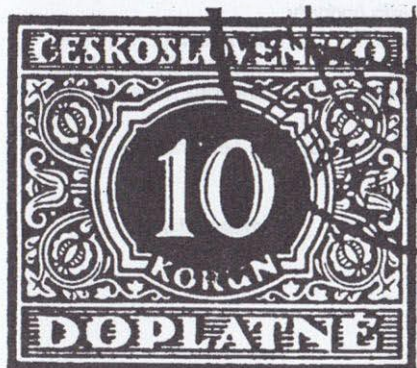
obr. č. 1

Při sestavování přepážkových archů doplatních 1928 hodnoty 10 Kč modrá podle studie pana Zdeňka Ryvoły z Havlíčkova Brodu jsem našel svislou dvoupásku ZP 81, 91 (obr. 1) a později dvě samostatné známky ZP 91 (obr. 2 a 2a) z tiskové desky s označením 28/1 s částmi otisku upevňovacího hřebíčku, u samostatných známek s porušením levého rámu vedle otisku upevňovacího hřebíčku.