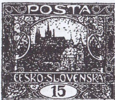
96. ZP VII. TD 4. spirála I. typ, bílý bod nad spoj. 4. a 5. spirály a v dolním obloučku Š v ŠTA.