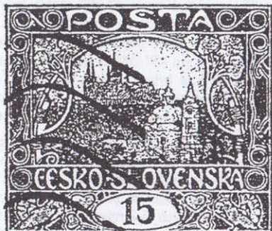
93. ZP VII. TD. Levá příčka II. a typ, přerušená levá spojnice háčků pod 2. háčkem.