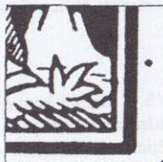
R 68/1 B

Důvodem upřesnění místa retuše R 68/4 Ba bylo předložení osmibloku ražených známek na kterém se nacházely všechny vady a retuše již vícekrát ověřené na první tiskové desce.