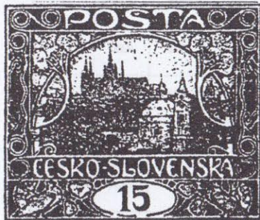
78. ZP VII. TD. Dole přerušeny 2x ovál, barevný bod nad číslicí 1.