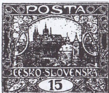
49. ZP VII. TD. 4. spirála I. typ, tečka v okraji nad T a proti pravé holubici, barevná čára vedle pravého rámu.