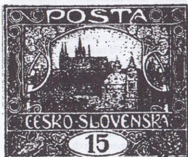
13. ZP. VII. TD. Levá příčka II. typ, levá nožka A v TA spojena se 6. listem.