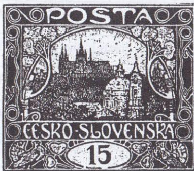
78. ZP VIII. TD. -černotisk. (?) Bez bodu nad číslicí 1, odchýlné paprsky.